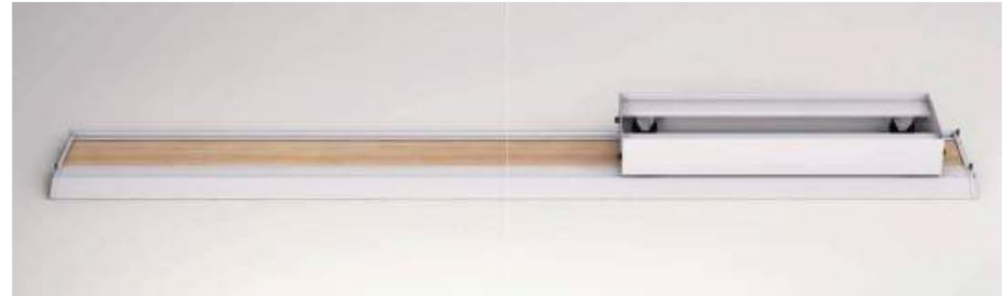
Sistema lateral 1200x450 / Système lateral 1200x450 / Lateral system 1200 x 450

Le secret est dans le 'easy' The secret is the "easy"