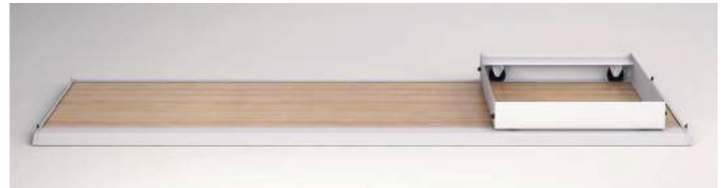
Sistema frontal 1200x900 / Système frontal 1200x900 / Frontal system 1200 x 900

Base equipada con 2 raíles con sistema antivuelco, tarima de melamina chapada a doble cara de 19mm, sistema de nivelación de hasta 30mm y una resistencia total de 5.000kg por plataforma.